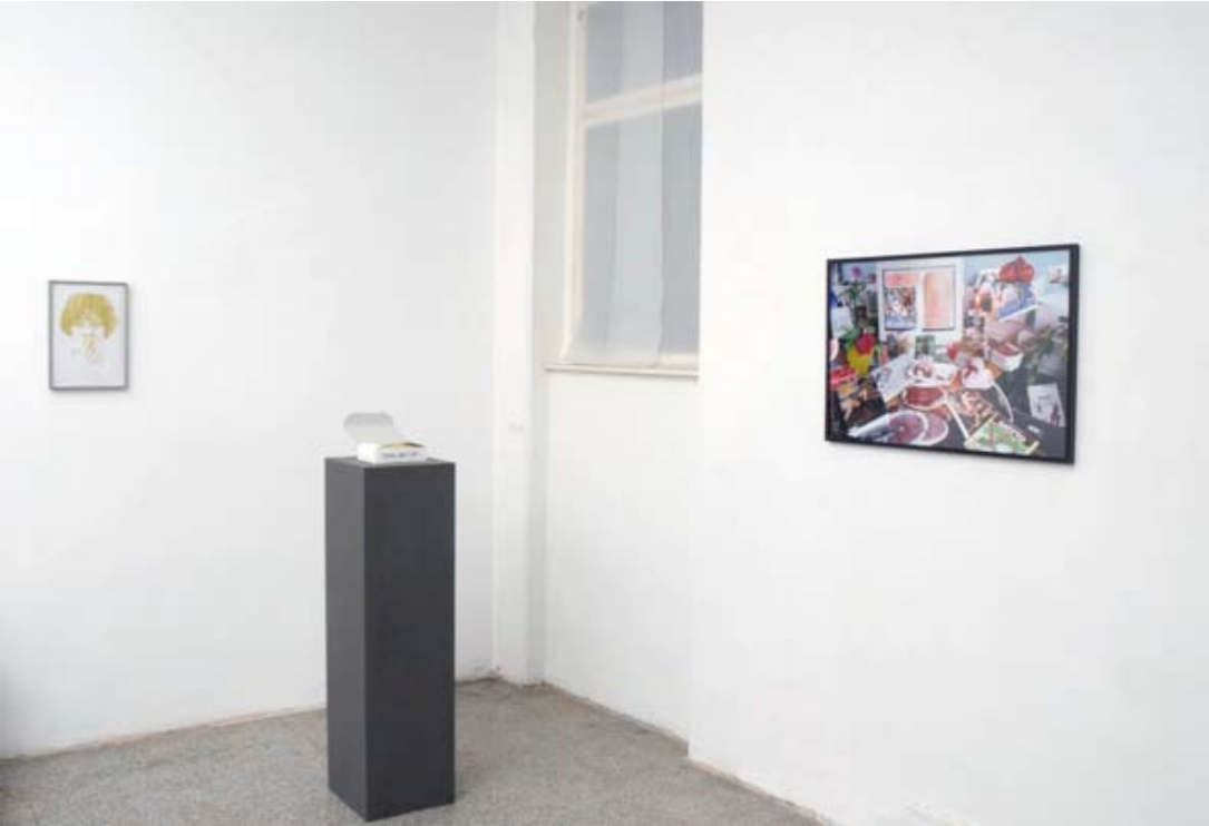
»golden faces alba«, Zeichnung, Varady; »l'età dell'oro« Objekt D'Urbano, »interior« Inkjet-Druck auf Barythpapier, D'Urbano