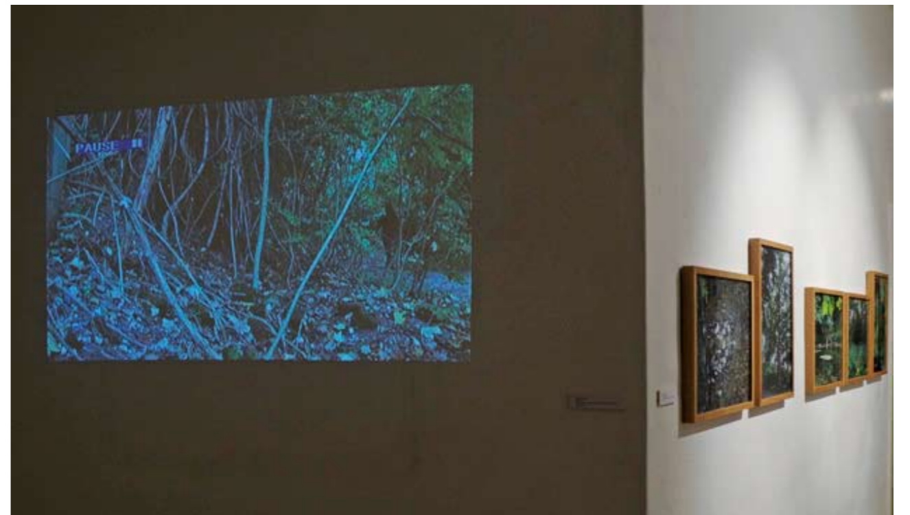
»son_no«, Video, D'Urbano