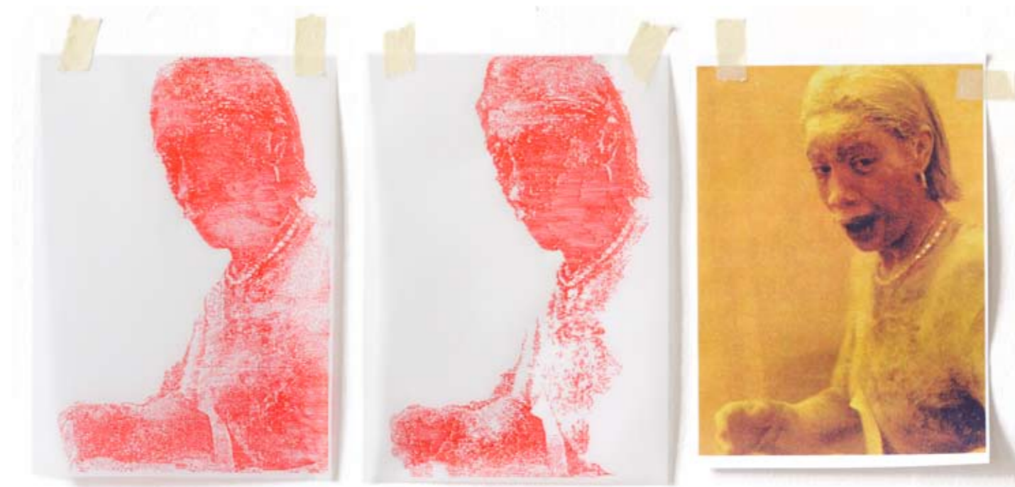
Ohne Titel, Dagmar Varady 2009