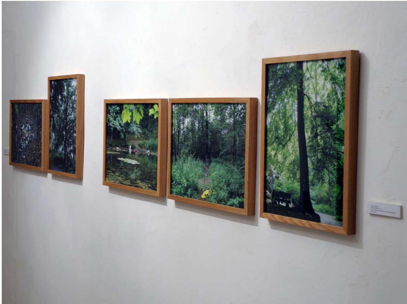
»natura morta«, 5 Fotografien, D'Urbano