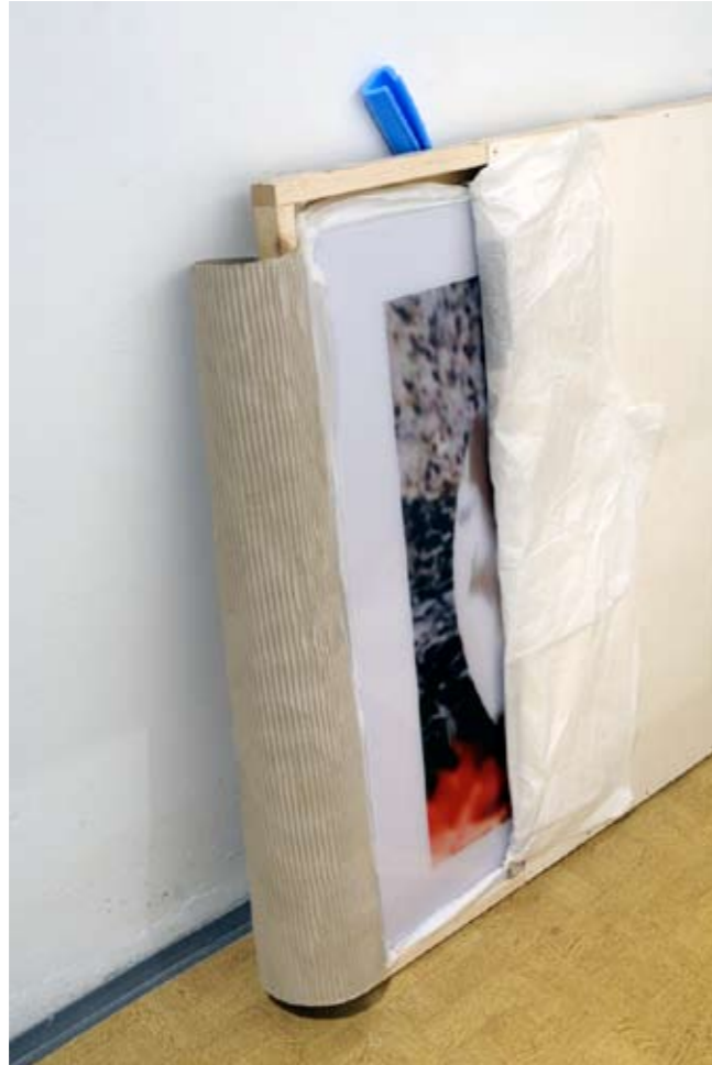
»virginsnow«, 2007-09, verpackt, Varady