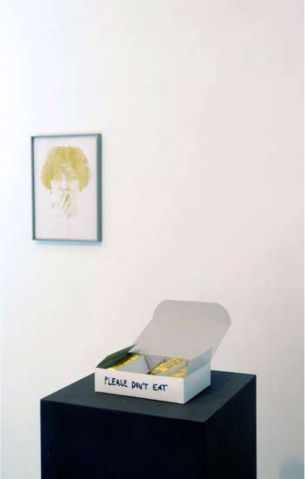
»golden faces alba«, Zeichnung, Varady; »l'età dell'oro«, Objekt, D'Urbano