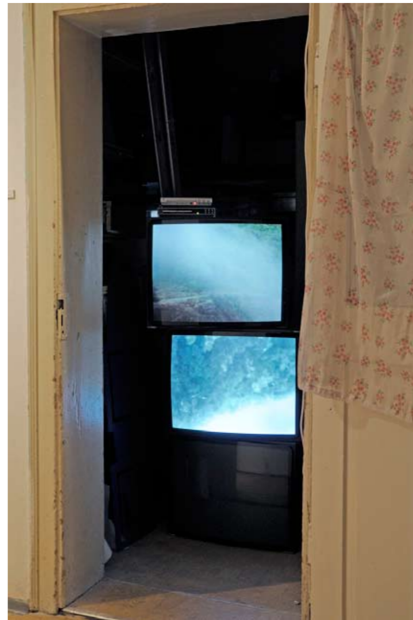
»garajonay«, 2009, Varady