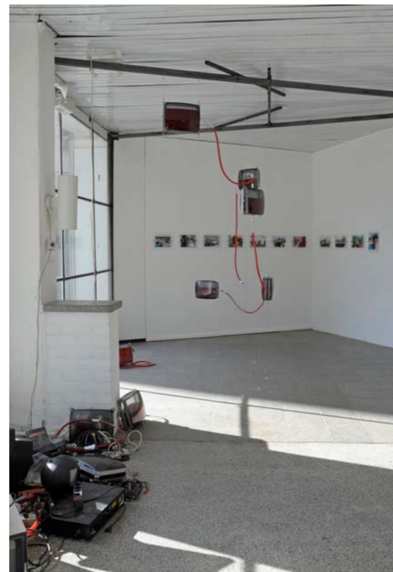
Installation »erröten«, D'Urbano/Varady