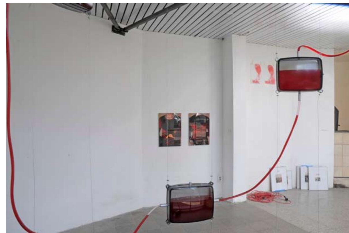
»intimate: tina«, 2 Fotografien, »monito_raggio« D'Urbano; »redden«, Zeichnung/Kopie, Varady; »bilderdestages«, 11.9.09