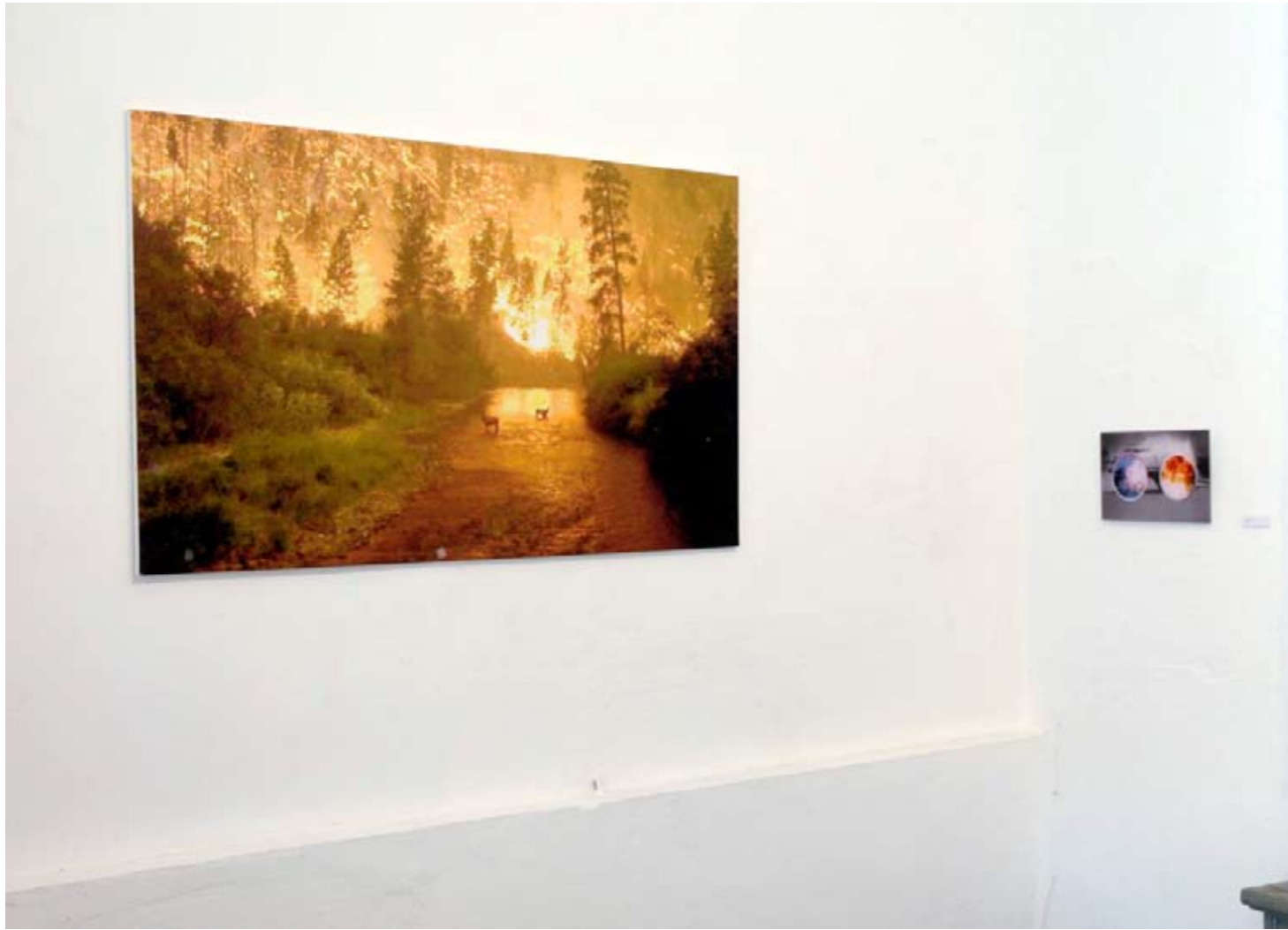
»speed up – slow down«, Varady; "inflamed", Varady