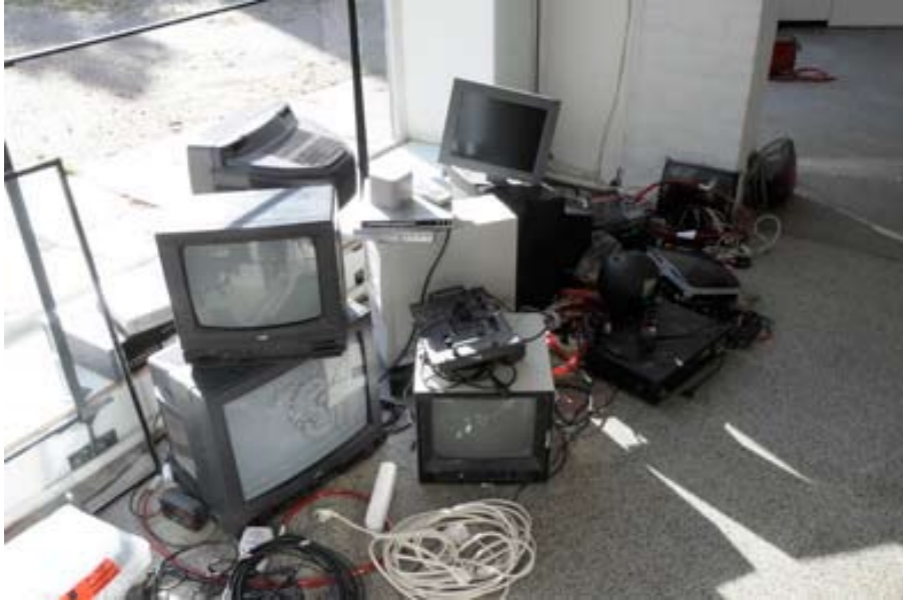
»grisaillemovie/into-05«, Varady, Installation »erröten« D-Urbano/Varady