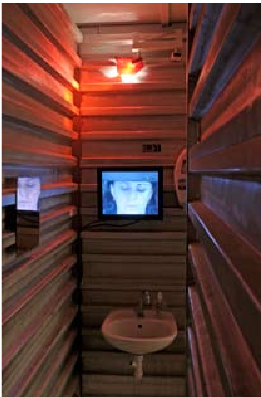
»airbag«, Videoinstallation, D'Urbano