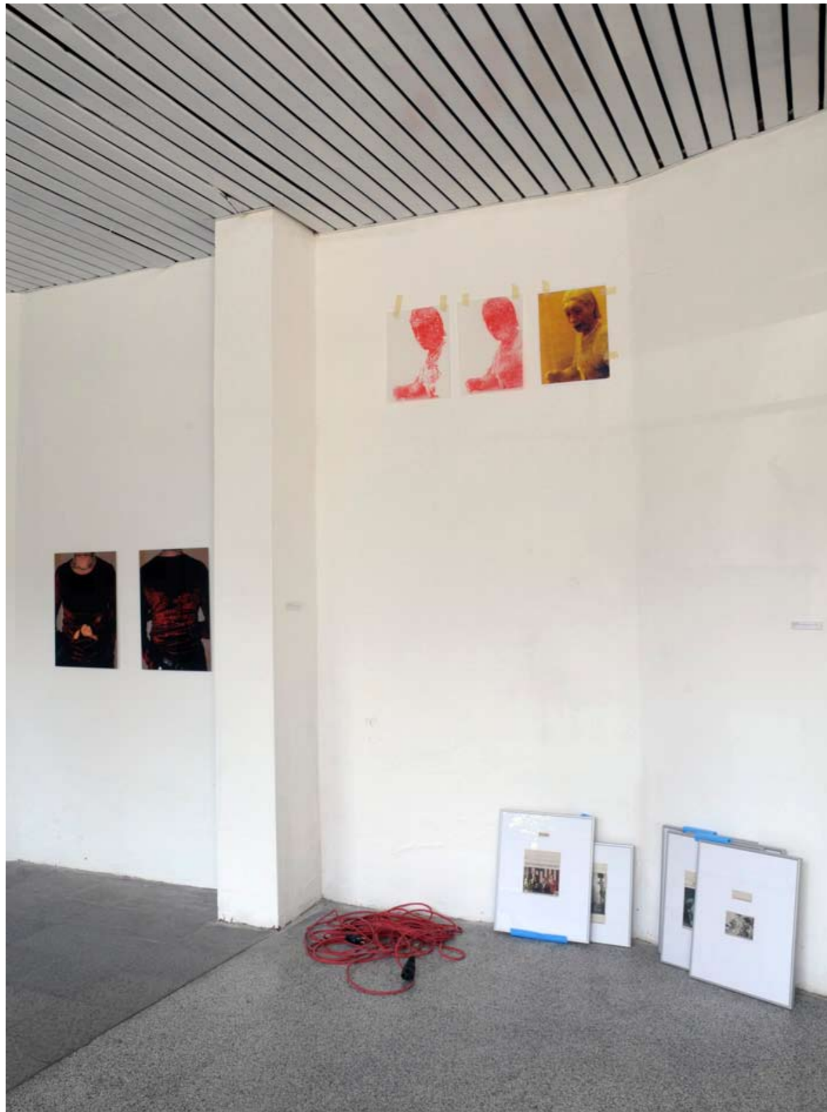
Installation »erröten«, D'Urbano/Varady, Detail